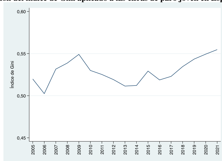
Gráfico 1. Evolución del índice de Gini aplicado a las cifras de paro joven en España.

Fuente: Elaboración propia a partir de los datos de la EPA.