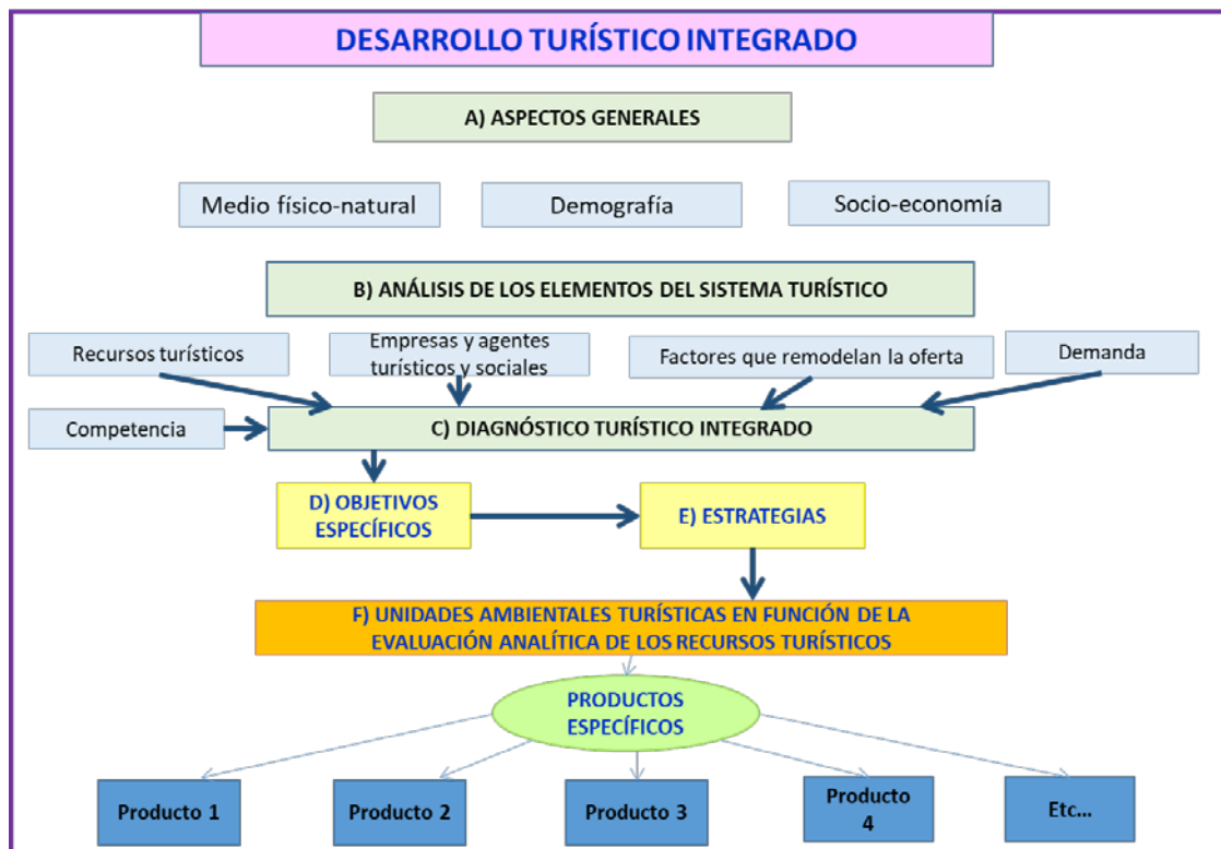
Figura 1. Objetivo General y Metodología

el territorio, los recursos turísticos, la oferta, la accesibilidad a través de las infraestructuras, los servicios, los agentes sociales, entre otros; y en segundo lugar un análisis externo en el que se integró la demanda turística, el análisis de espacios y destinos competidores, las tendencias socio-demográficas, culturales, medioambientales, etc. La elaboración de esta fase se apoyó en fuentes de información, secundarias y primarias, donde se analizaron estudios, informes y estadísticas oficiales. También se llevó a cabo un análisis del perfil del turista de interior.